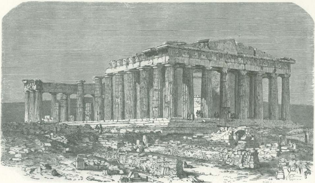
THE PARTHENON, ATHENS.