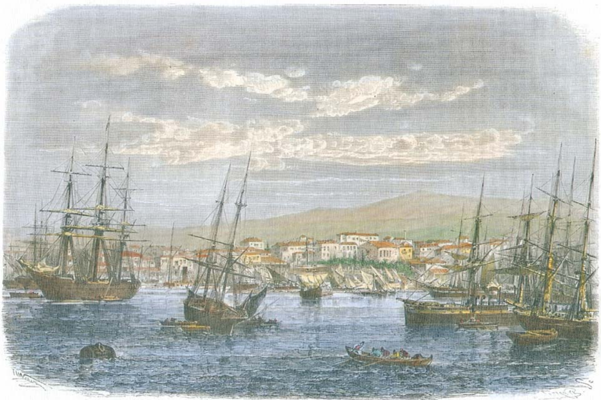
Vue générale du Pirée (voy. p. 15). — Dessin de Th. Weber, d'après une photographie.