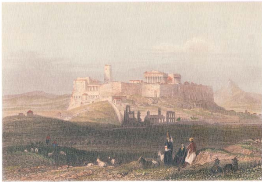
Athens from the Hill of the Museum