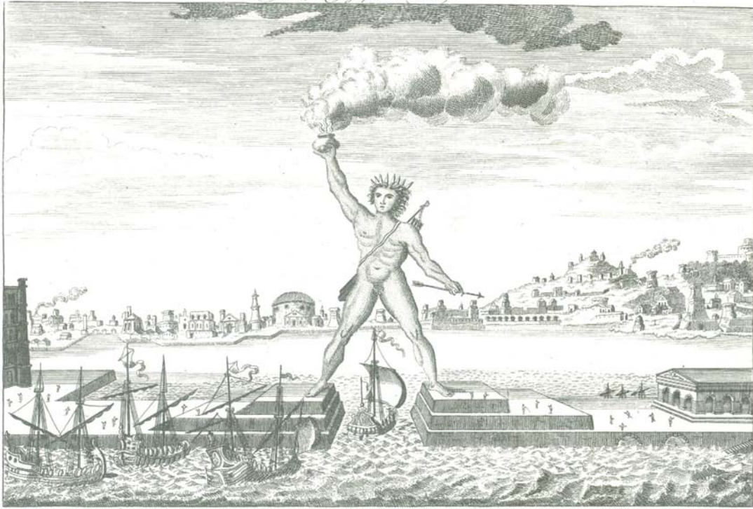
The Colossus of Rhodes, a prodigious brass statue dedicated to the Sun, which holding fire in its right hand served for a sea light to ships; for lighting the fire there was a stair case went through one of his legs, through the inside of the body and arm.